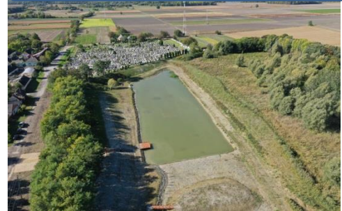
Többmedencés vizesélőhely, előöntések kezelése