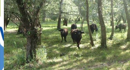
Komplex ártéri adaptációs modell