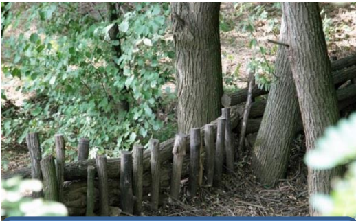
Lefolyáslassítás szivárgó rönkgátakkal

LIFE-MICACC projekt LIFE16 CCA/HU/000115