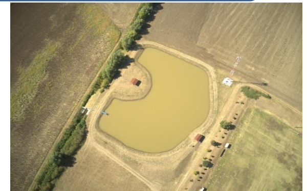
Vízvisszatartáson alapuló aszálykockázat-kezelés